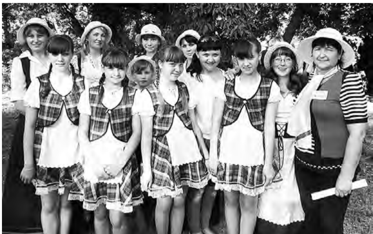
Участники праздника «Лиго» из Шарাপовки.