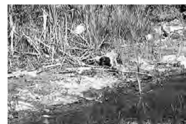
Неприглядную картину оставляют после себя у водоемов любители отдыха на природе.

сходов граждан, индивидуальных бесед. На 1 июля было распространено 40 листовок, проведено 10 сходов граждан в сельских поселениях, состоялось 2700 индивидуальных бесед с гражданами района. Совместно со службой участковых уполномоченных ОМВД России по Марьяновскому району, МЧС, представителями администраций городского и сельских поселений проведено семь рейдов, в ходе которых проверкой были охвачены все водоемы района. Подготовлена и направлена информация